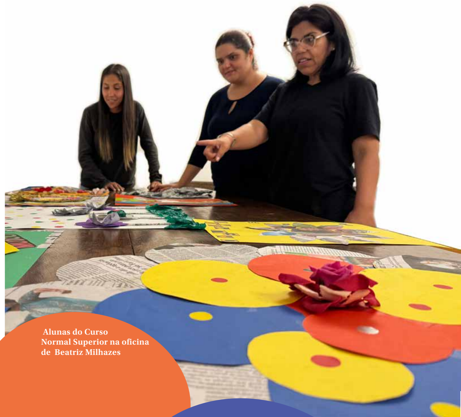
Alunas do Curso Normal Superior na oficina de Beatriz Milhazes