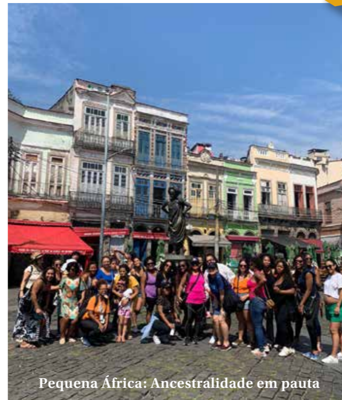
Pequena África: Ancestralidade em pauta