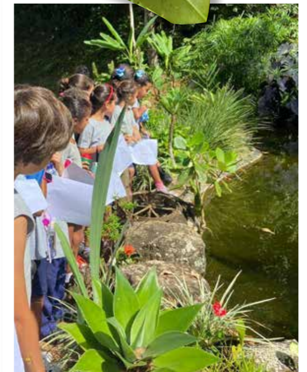
Aula no Canto de São Francisco

Sua presença na vida da escola foi crescendo ao longo dos anos e, em 2024, ao abrigar a exposição de encerramento do ano “Canto de São Francisco, ciência e arte no museu a céu aberto”, firmou-se como símbolo da educação defendida pelo Pró-Saber. O museu a céu aberto tornou-se um importante projeto institucional, como foi visto no início deste relatório anual.