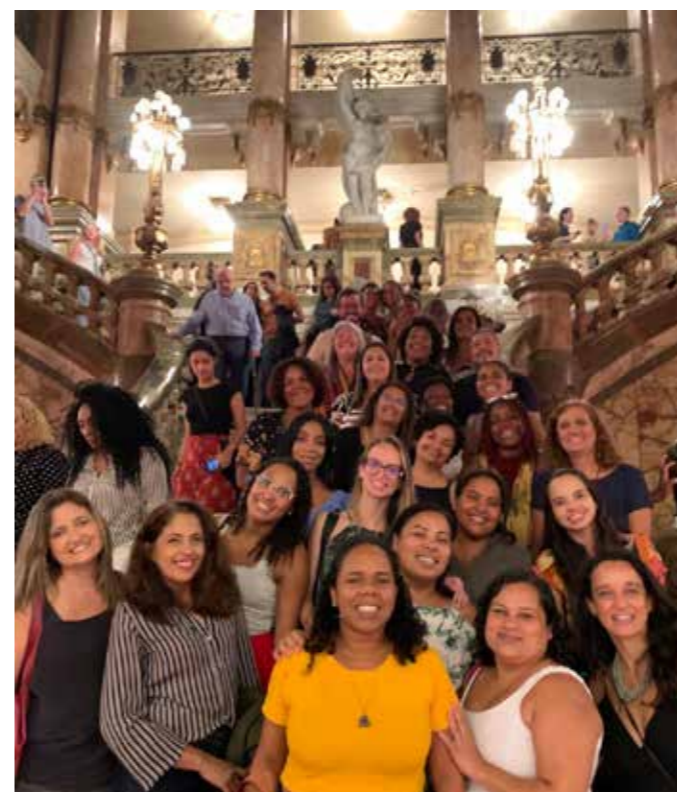
Teatro Municipal: “Sagração”, de Deborah Colker

O programa tem por objetivo ampliar o repertório dos professores/alunos da Graduação, valorizar a bagagem trazida por cada um deles e estabelecer um diálogo entre essas ações culturais. Em 2024, a ancestralidade norteou várias atividades, entre elas uma visita à região conhecida como Pequena África, organizada em parceria com o museu virtual Rio de Memórias e a peça “Ponciá Vivêncio”, de Conceição Evaristo, baseada no primeiro romance da escritora mineira.