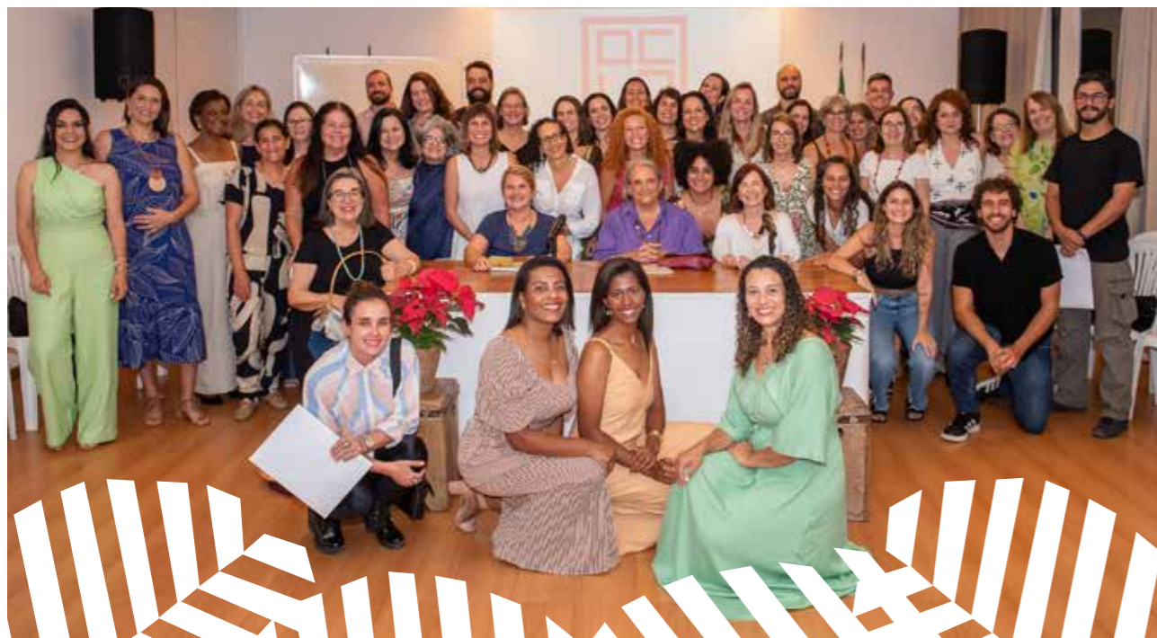
Formatura das turmas 2021 da Pós-Graduação em Psicopedagogia

“Durante o curso de Psicopedagogia fui refletindo e mudando meu olhar sobre minha prática como professor. Pude ampliar meu olhar sobre as crianças na escola e educá-las reconhecendo as dimensões que as constituem e como se articulam. O entendimento da história e do contexto das crianças ali presentes na rotina assim como a parceria com as famílias ganharam novos sentidos.”