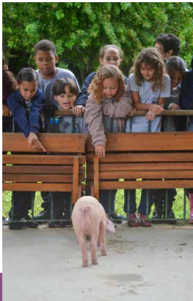
Crianças da Padre Quinha conhecem Rabicó

“Acho que aqui era o sítio. Quando eles saíram para uma aventura, virou escola. Mas agora eles voltaram. Então é um sítio-escola!”