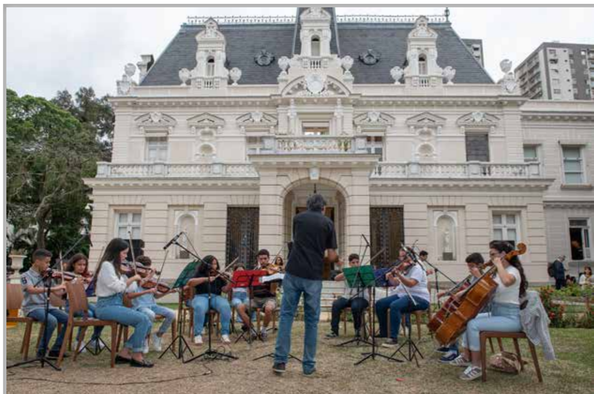
Camerata Canto de São Francisco em apresentação na Casa Firjan