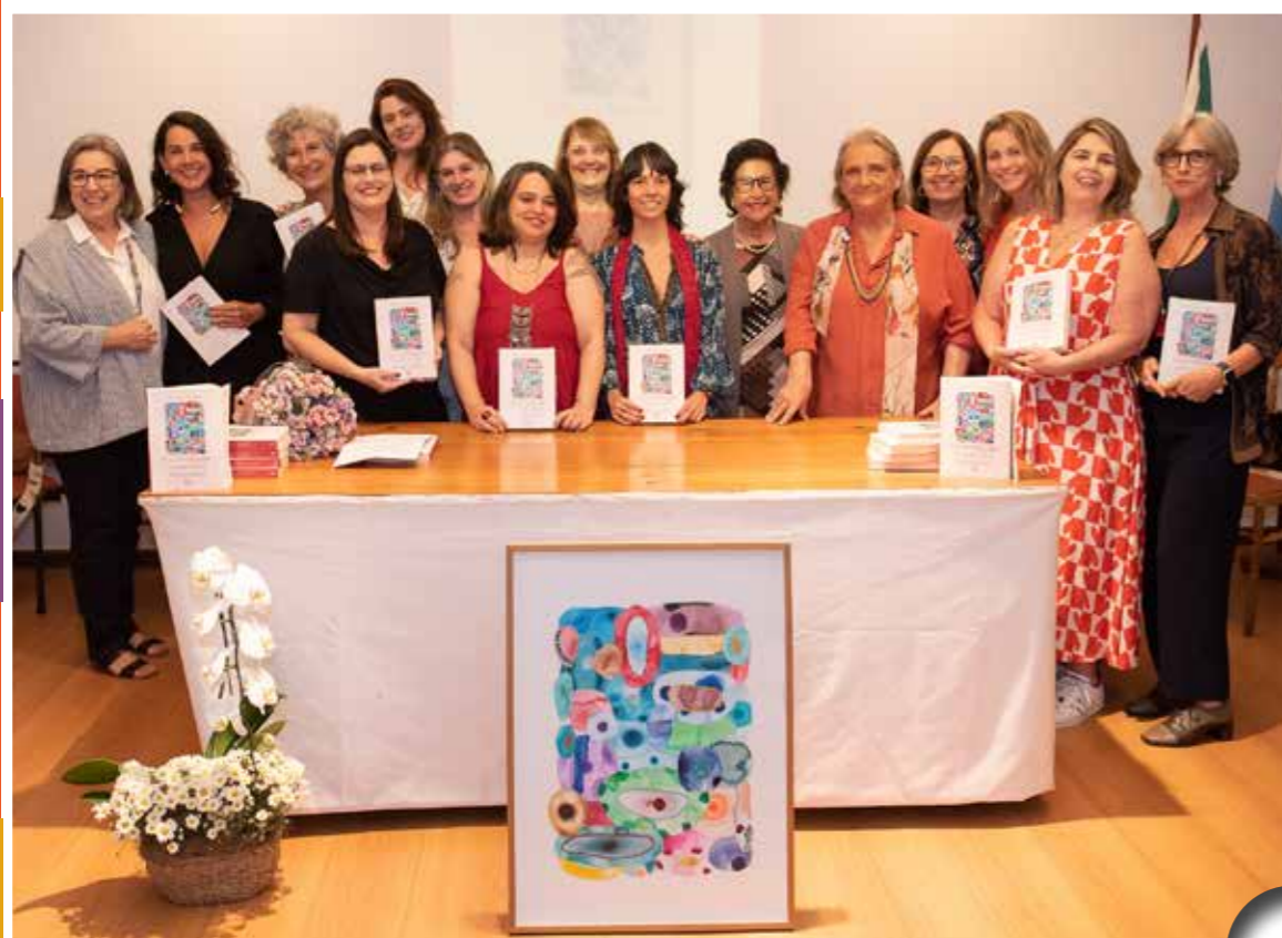
Lançamento livro “O Jardim dos Improváveis”: artigos da equipe da Clínica Psicopedagógica

“Percebemos o psicopedagogo como um agente de transformação. Assim sendo, tem funções, sabe o que pode e o que deve fazer, e como agir. Sabeda importância do acolhimento, do olhar e da escuta”.