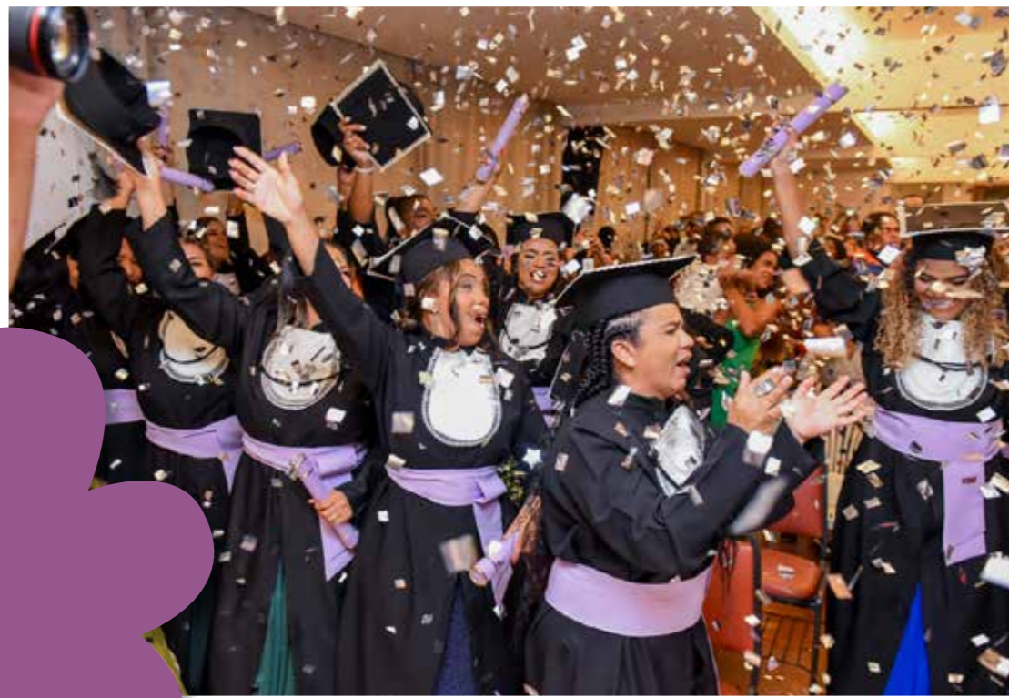
Formatura da turma 2022 do Curso Normal Superior

“Saber Literatura” provocou a turma a pensar sobre a importância da literatura na formação das crianças e sobre a responsabilidade dos espaços de educação de oferecer qualidade literária às crianças desde bem pequenas. Em cada aula foi disponibilizado um pequeno acervo diferenciado de literatura infantil, para conhecimento, manuseio e ampliação de olhares. No trabalho final, cada aluna apresentou o planejamento de uma aula envolvendo livros e leitura.