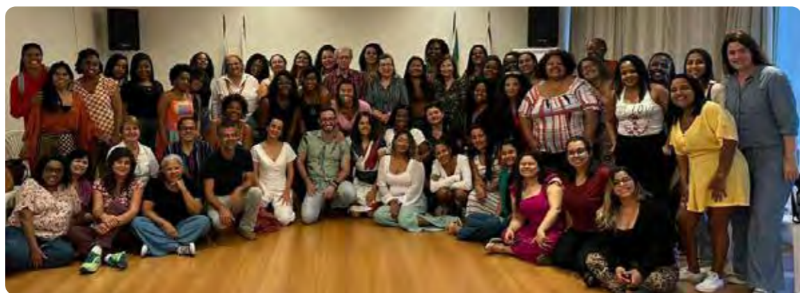
Turmas 2022 e 2023 com a equipe do Pró-Saber: dois encontros de reflexão sobre Educação com o frade dominicano Frei Betto