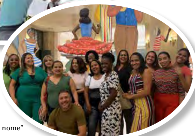
Exposição “Heitor dos Prazeres é meu nome”