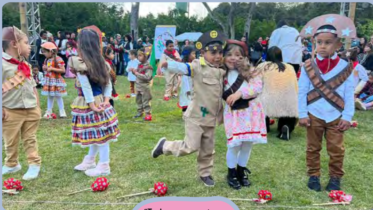
O grande “arraiá julino” da Escola Padre Quinha

“Todos somos atores porque atuamos e somos espectadores de nós mesmos”