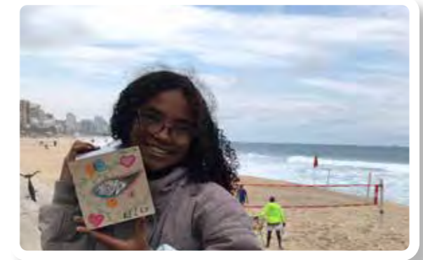
Aluna do CIEP Adão Pereira Nunes mostra seu trabalho

Uma parceria entre o Instituto Beja e o Pró-Saber rendeu boas experiências para crianças e suas famílias na Praça Atahualpa, no Leblon. A praça foi restaurada pelo Beja, que patrocinou atividades aos sábados, com programação a cargo do Pró-Saber. Teve contação de histórias, ioga, dança, música, pintura, desenho, fotografia. Na oficina de fotografia, alunos do CIEP Adão Pereira Nunes, de Irajá, na Zona Norte, fizeram brincadeiras com luz, aprenderam sobre enquadramento e construíram suas câmaras escuras. No final, pediram para ir até a praia. Algumas crianças nunca haviam visto o mar.