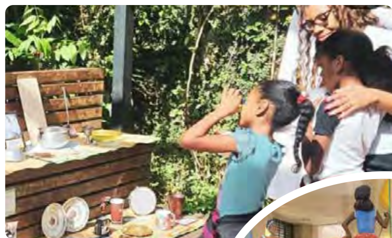
Exposição das alunas, Turma 2022

O trabalho da Alfabetização Cultural multiplica-se nas instituições onde esses profissionais trabalham, tanto inspirando propostas para as crianças quanto despertando o desejo de buscar experiências culturais em família.