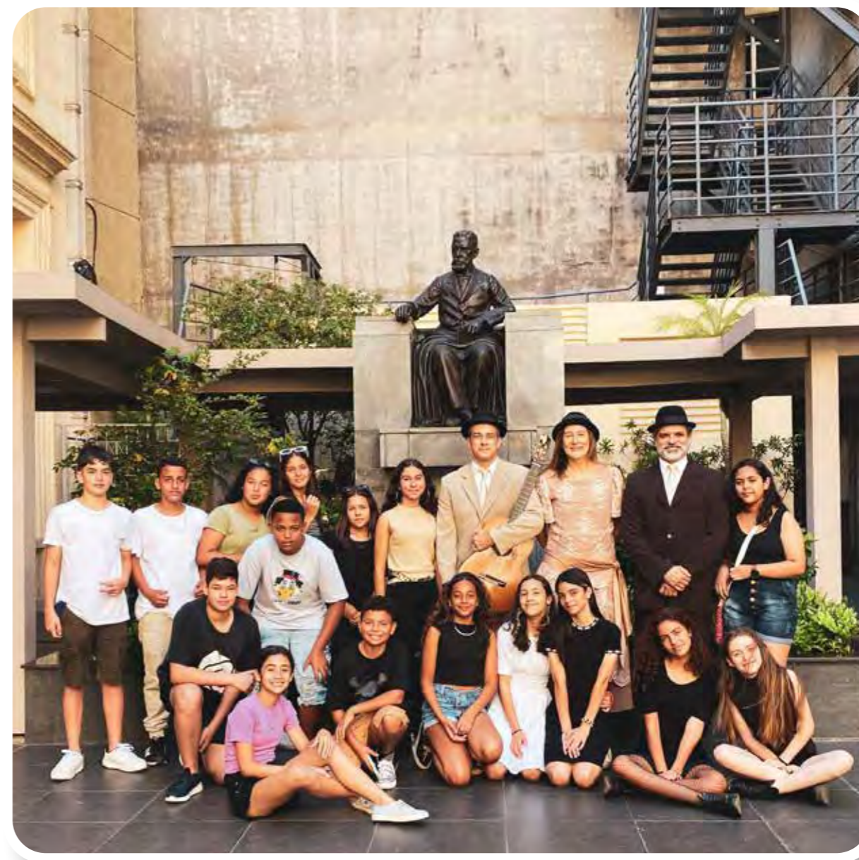
Alunos do Integral II em frente à estátua de Machado de Assis, em visita à Academia Brasileira de Letras.

Em 2023, 20 jovens participaram do Integral II.